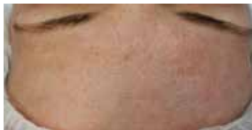
Nach der 1. Behandlung