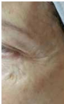
Nach der 1. Behandlung

«Wow, meine Haut sieht fantastisch aus und das nach nur einer geneo-Behandlung!»