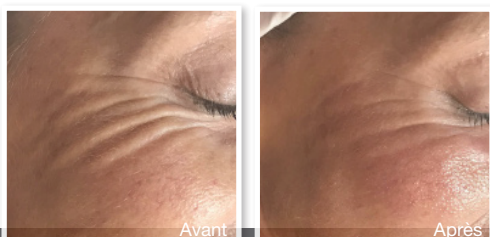
Amélioration du contour des yeux après un traitement