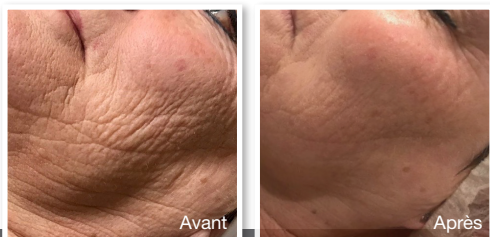
Amélioration de l'ovale du visage après 4 traitements