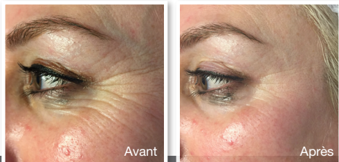
Amélioration du contour des yeux après un traitement